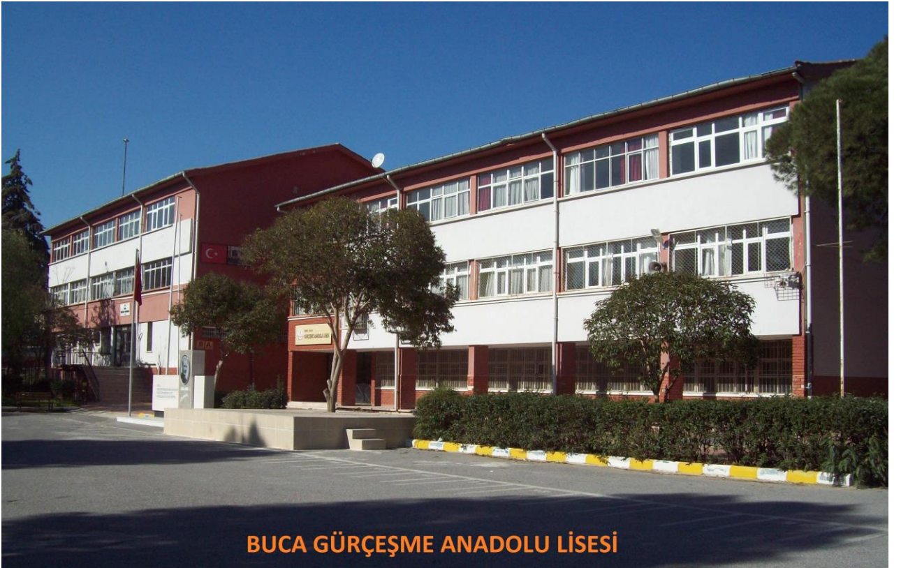
BUCA GÜRÇEŞME ANADOLU LİSESİ