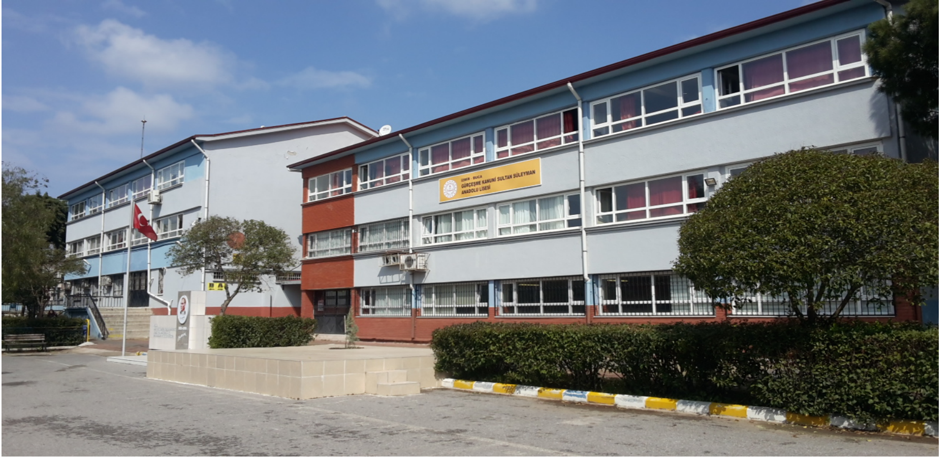
BUCA GÜRÇEŞME KANUNİ SULTAN SÜLEYMAN ANADOLU LİSESİ